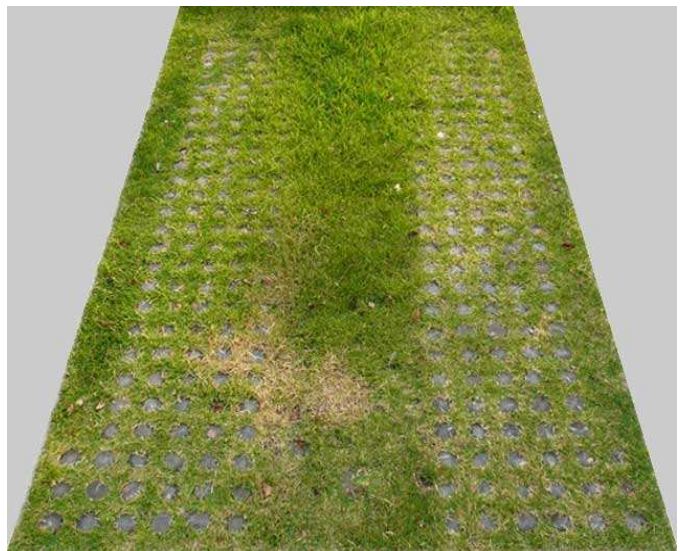
▲兵庫県庁敷地内 施工後3年経過

平成17年度より兵庫県庁敷地内で行われた芝生駐車場の実証実験に参加しました。都市部のヒートアイランド対策や都市景観の向上に効果が期待される「グラスパーキング」(芝生化駐車場の)普及促進をめざしての実験です。産官学民の誰もが自由に参画できる「ひょうごGPフォーラム」が設置され、ターフ・ウッド工法は実験の結果、高評価をいただきました。