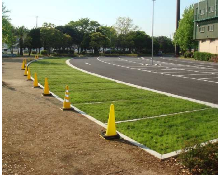
▲平成26年 和歌山県 紀三井寺公園(野球場)駐車場施工